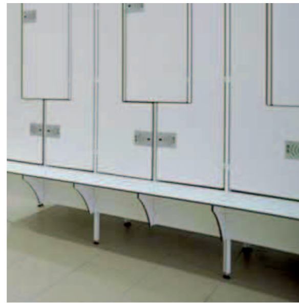
Vorgebaute Sitzbank, Standardausführung

Bankauflage aus 10 mm HPL-Compact mit vorderer, gerundeter Abkantung. Bei dieser Variante wird die Bank stärker betont und erscheint massiver. Die Unterkonstruktion entspricht der Standardvariante. Zusätzliche Schuhablage aus eloxierten Aluminium-Rundstäben zwischen den Konsolträgern.