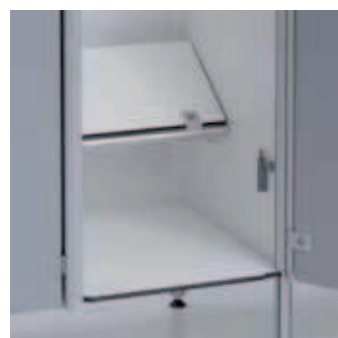
Schuhfach mit klappbarer Abdeckung