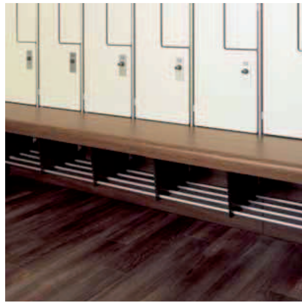
Vorgebaute Sitzbank, Postforming

Bankauflage aus 10 mm HPL-Compact mit vorderer, gerundeter Abkantung. Bei dieser Variante wird die Bank stärker betont und erscheint massiver. Die Unterkonstruktion entspricht der Standardvariante. Zusätzliche Schuhablage aus eloxierten Aluminium-Rundstäben zwischen den Konsolträgern.