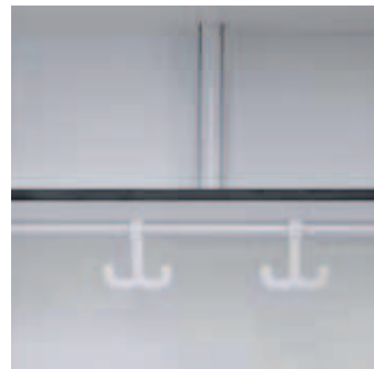
Obere Ablage Kleiderstange mit Haken

Bankauflage aus 10 mm HPL-Compact auf Konsolträgern, fest mit dem Schrankkorpus verbunden. Verblendung der Schrankfront unterhalb der Bank mittels Bankblenden, so dass die volle Schrankinnenhöhe erhalten bleibt. Farben frei wählbar gemäß der aktuellen Farbkarte.